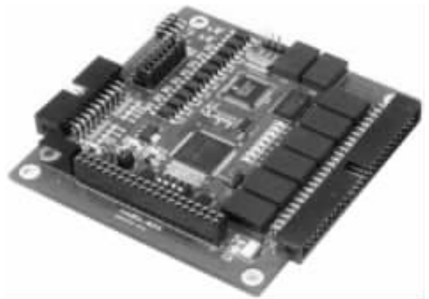
图 4 MiniISA-8016A 数字量输入继电器输出板卡

广州致远电子有限公司同时提供了一系列基于 MiniISA 总线的数字量输入继电器输出板卡、模拟量输入板卡、模拟量输出板卡、直流电机控制板、GPRS 控制板卡等一系列与之配套的工控板卡。为了使客户充分了解 MiniISA 总线,SmartARM2300 开发套件预留了一个 MiniISA 总线接口,并提供 MiniISA-8016A 数字量输入继电器输出板卡,如图 4 所示,该卡提供 8 路隔离数字量输入,在噪声环境下为采集数字量提供 1500V DC 的隔离保护;它带有 8 个继电器,可以用作开/关控制设备或小型电力开关;此外它还带有 2 个可由用户自定义的隔离脉宽调制 PWM 输出。