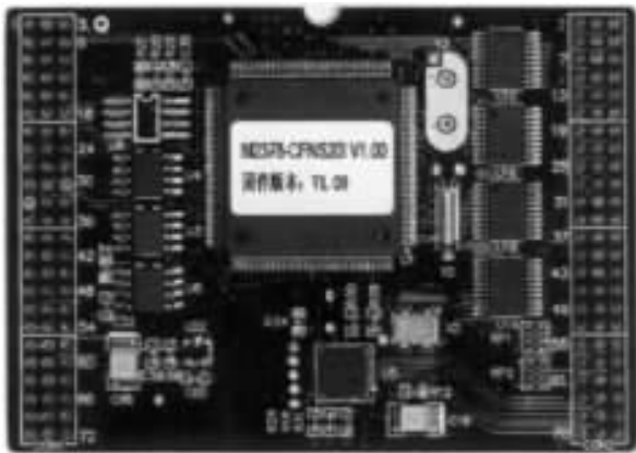
图 3 MiniARM23 嵌入式工控模块

MiniARM M23A 是一款以 LPC2300 系列 ARM 为核心的嵌入式工控模块,如图 3 所示。致远电子不但提供各种成熟硬件解决方案,而且提供包括正版 \mu\text{C}/\text{OS-II} 实时操作系统在内的丰富软件资源。完整的软硬件架构使开发者只需专注于编写产品的应用程序。采用 MiniARM 嵌入式工控模块开发产品,操作均通过读、写等几种基本函数实现。只要有 C 语言基础,几行代码即可实现 TCP/IP 通信、CAN-bus 现场总线通信、USB 通信和大容量存储等复杂功能,使嵌入式系统设计更加简洁方便。