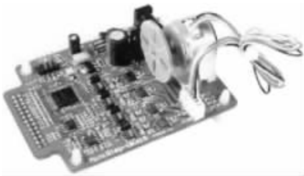
图 2 电机驱动模块

以电机控制系统为例,致远电子提供了电机驱动板,如图 2 所示。利用 SmartARM2300 开发套件和相应的电机驱动模块可以迅速搭建硬件平台。